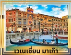
เวเนเชียน มาเก๊า