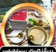
บุฟเฟ่ต์ซาบู เมียร์โมอัน!!