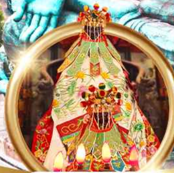
ยืมเงินเจ้าแม่กวนอิมสองฮา