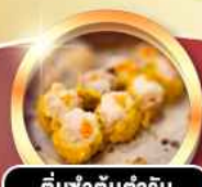
ต้มซ่าตันตำรับ