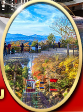
ภูเขา ทาคาโอะ

ปราสาทนัตสึไมด์ Starbuck Snow Peak Land วัดเซ็นโซจิ