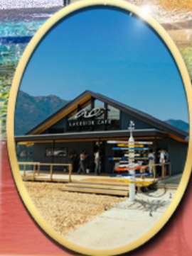
Ao Lakeside Cafe

34,919 ราคาเริ่มต้น บาท รวมภาษีมูลค่าเพิ่ม 7%