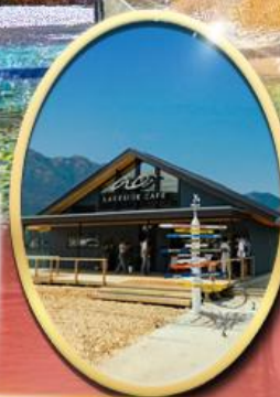
Ao Lakeside Cafe