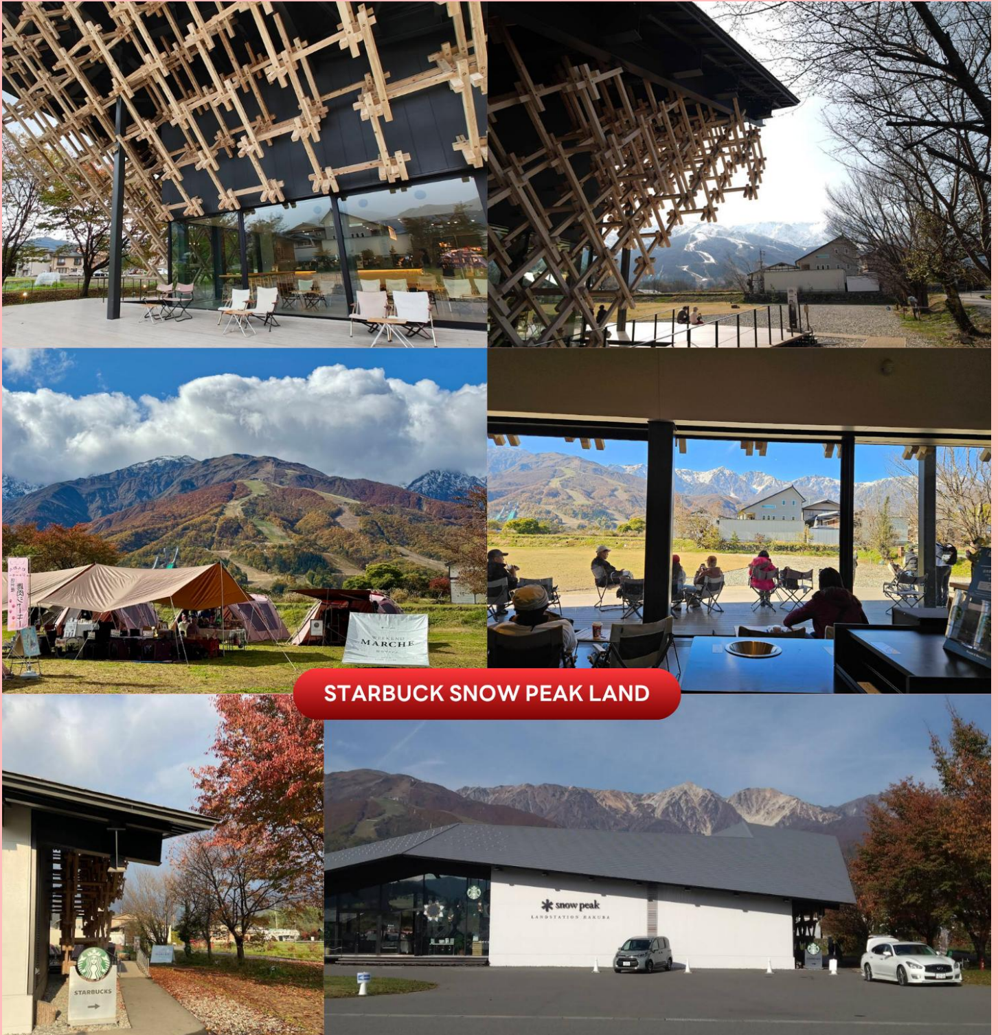
STARBUCK SNOW PEAK LAND

นำท่านจิบกาแฟพร้อมกับชมวิวทิวทัศน์ธรรมชาติอันงดงามของฮาคุบะที่ Starbuck Snow Peak Land ตั้งอยู่ที่ Snow Peak Land Station Hakuba สถานที่ที่จัดแคมป์ท่ามกลางธรรมชาติอันอุดมสมบูรณ์ ที่มีเทือกเขางามเป็นฉากหลัง มีที่นั่งในร่ม และกลางแจ้งให้ได้เลือกเสพบรรยากาศตามใจชอบ พร้อมจำหน่ายสินค้าฉลองการเปิดตัวด้วยสกรีนยืดห่อ Snow Peak ลงในผลิตภัณฑ์ที่จำหน่ายภายในสตาร์บัคส์ด้วย (ราคาทัวร์ไม่รวมค่าเครื่องดื่ม)