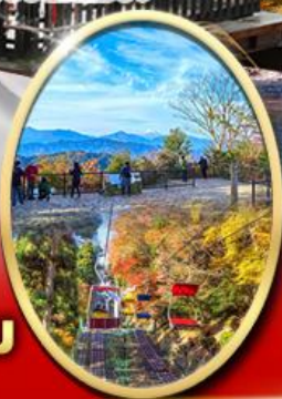
ภูเขา ทาคาโอะ

ปราสาทดสิโมไต Starbuck Snow Peak Land วัดชินโซจิ