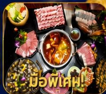
บุฟเฟ่ต์ชาบูสโด้ฮ่องกง