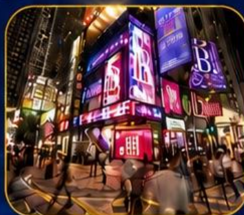
ซอปปิงชินซาฮุย