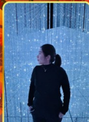
ทึบแอบโตเกียว