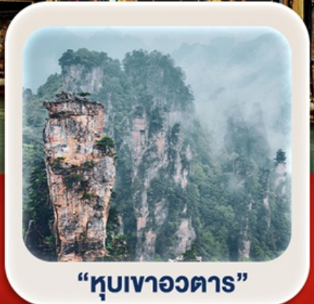
“หุบเขาอวตาร”

นั่งกระเช้าชมภูเขาเทียนเหมินซาน • กำประตูลั่ว • ตึกมหัศจรรย์ 72 ชั้น เมืองโบราณเฟิ่งหวง (ล่องเรือ) + เมืองโบราณฟูหรงเจิน **พักติดเมืองโบราณ 2 คืน** ภูเขาเทียนจื่อซาน • หุบเขาอวตาร • สะพานแก้ว+VR4D • ชมโชว์จิ้งจอกขาว