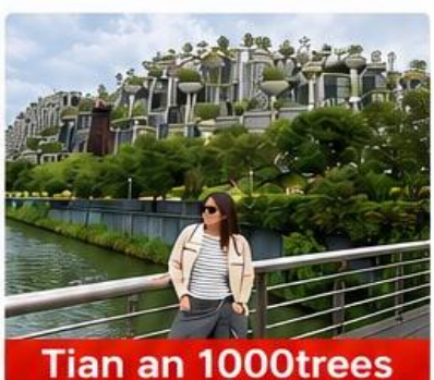
Tian an 1000trees