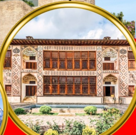
Palace of Shaki Khans