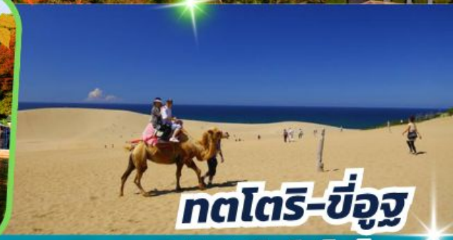
ทตโตริ-ซึอูจ