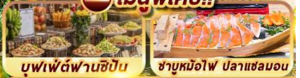
บุฟเฟ่ต์ฟานซีปัน