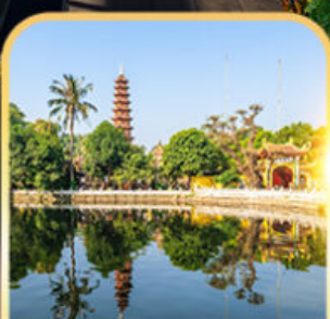
วัดเงินทิวก