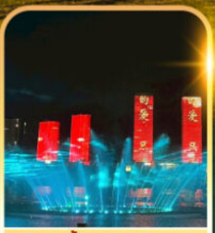
น้ำพุคังบาชิ