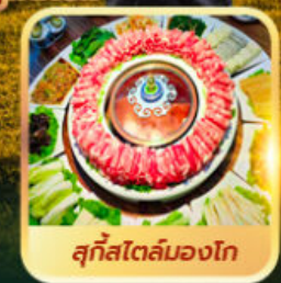
สุกีสโตล์มองโก