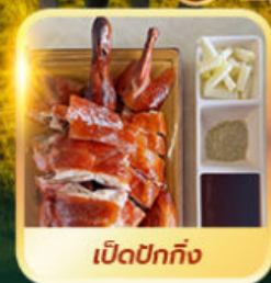
เปิดปอกกิ้ง