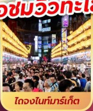
ไถจงไนท์มาร์เก็ต