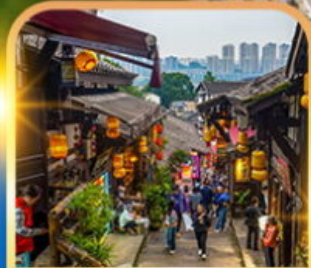
หมู่บ้านโบราณฉือชี่โจว