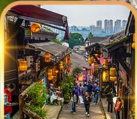
หมู่บ้านโบราณฉือซีโจว