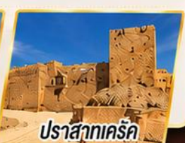
ปราสาทครีค