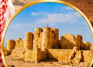
กลุ่มปราสาททะเลทราย (Desert Castles)