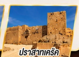
ปราสาทเคร์ค