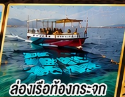
ล่องเรือท้องกระจก