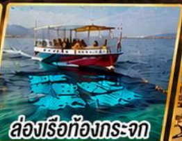
ล่องเรือท้องกระจก