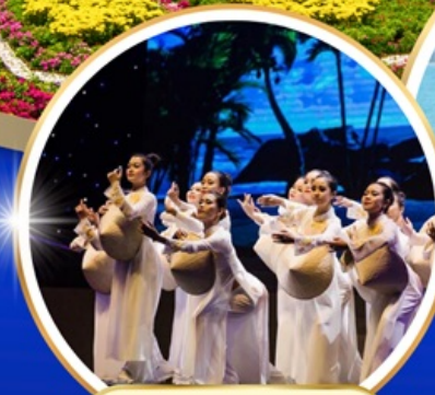
Charming Danang Show