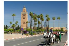
นั่งรถม้าชมเมือง

** พักที่ Adam Park Hotel 5* หรือเทียบเท่า **