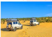
ทะเลทรายซาฮารา

** พักที่ Zahra luxury Desert Camp 4* หรือเทียบเท่า **