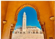
สุเหร่าแห่งกษัตริย์ฮัสซันที่ 2

06.10 น. เดินทางถึงสนามบินอิสตันบูล แวะเปลี่ยนเครื่อง 11.50 น. ออกเดินทางสู่สนามบินคาซาบลังกา เที่ยวบิน TK617 14.50 น. เดินทางถึงสนามบินคาซาบลังกา ประเทศโมร็อกโก