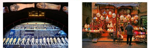
พิพิธภัณฑสถานแห่งชาติอียิปต์ ตลาดชานเอลคาลิลี

20.40 น. ออกเดินทางสู่อิสตันบูล เที่ยวบิน TK695