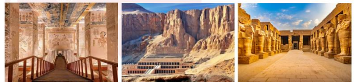
หุบผาซัตริย์ วิหารอักเซฟซุต มหาวิหารคาร์นัค

19.45 น. ออกเดินทางสู่กรุงโคโร สายการบิน...เที่ยวบิน... 21.00 น. เดินทางถึงสนามบินกรุงโคโร