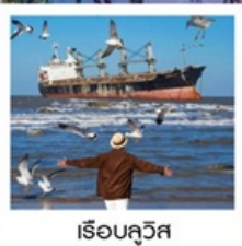
เรือลิวอิส