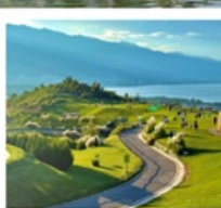
ภูเขาอวิ้นเซียงซาน