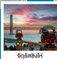
จัตุรัสซิงไห่