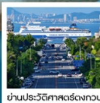
ย่านประวัติศาสตร์ตงกวน

Fisherman's Wharf • จัตุรัสซิงไห่ (รวมรถราง) • ถนนตงกวน • เวนิสแห่งต้าเหลียน • ถนนรัสเซีย