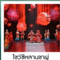
โชว์ซีหลานซาตู้