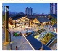
ถนนคนเดินไท่กุ่หฺลี่