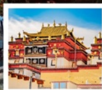
วัดชงจันหลิง