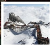
ภูเขาหิมะมั่งกรหยก