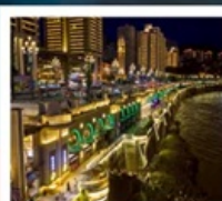
ถนนหนานปิ่น