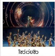
โชว์เว่ยซิว