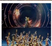
โชว์เว่ยชิว

เซี่ยงไฮ้ คลาสสิก ไนท์ (Shanghai Classic Night) หุบเขาเทวดาวังเซี่ยงกุ๋ (ชมบรรยากาศกลางวันและกลางคืน) หมู่บ้านโบราณหวงหลิ่ง (รวมกระเช้าไปกลับ) สะพานกระจก ถนนโบราณกุนซี / โชว์การแสดงเว่ยชิว / หมู่บ้านโบราณเฉิงชาน ถนนหวยไห่ (ร้านกระเป๋าสองมอนท์) / เช็กเมนู 3 ตึกใหญ่แห่งเซี่ยงไฮ้ Tian An 1,000 Trees / North Bund Green Land / ถนนอู่กิง