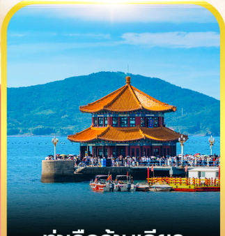
ท่าเรือจันทิว