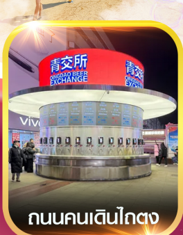
ถนนคนเดินโกตง