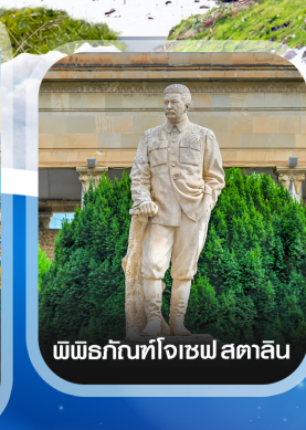
พิพิธภัณฑ์โจเซฟ สตาลิน

คอนเฟิร์มออกเดินทาง ทุกพีเรียด 2 ท่านขึ้นไป