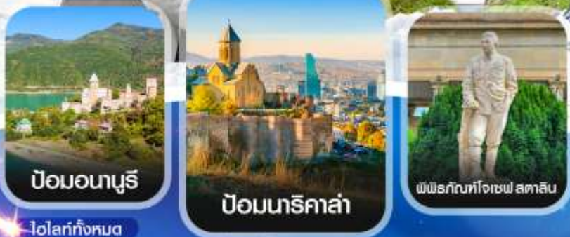
ป้อมอนาบุรี