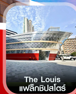
The Louis แพล็กชิปไคร้

✈️ คอนเฟิร์ม ออกเดินทาง ทุกพีเรียด 2 ท่านขึ้นไป