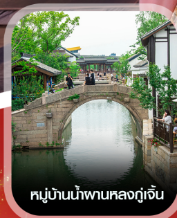
หมู่บ้านน้ำผานหลงกู่เจิน