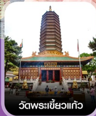
วัดพระเขี้ยวแก้ว