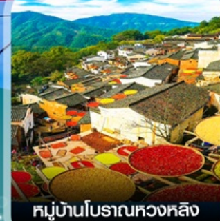
หมู่บ้านโบราณหวงหลิง (หมู่บ้านตากพรึก)