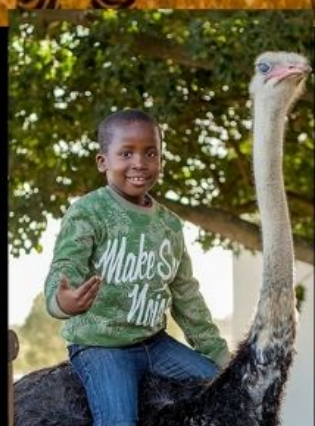
ฟาร์มนกกระจอกเทศ