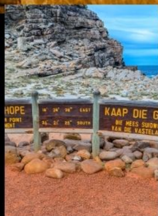
Cape good hope