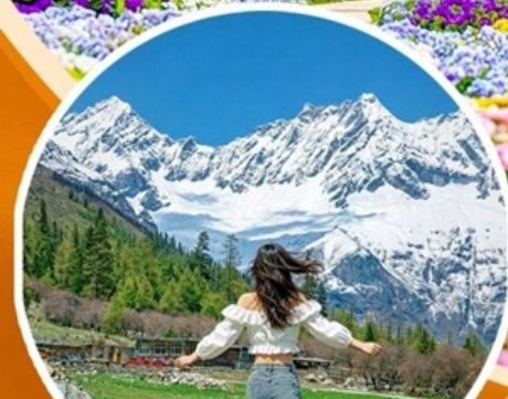
ภูเขาสี่ดรุณี ช่วงเลียวโกว (รวมปรดอุทยาน)