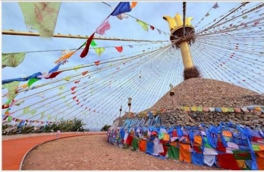
อี้เค่อโอบอ (Great Oboo, 伊克敖包)