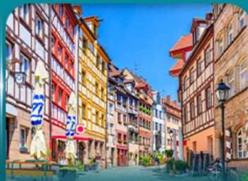
เที่ยวเมืองเก่าบูร์มเบิร์ก