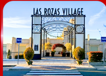
Las Rozas Village เอากีเลียน