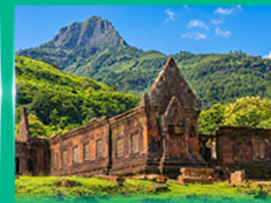
ปราสาทหินวัดพู