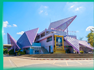
ด่านพรมแดนช่องเม็ก