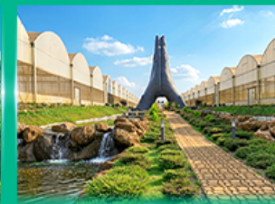
Agro Vege Farm