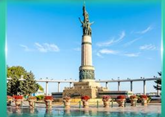
อนุสาวรีย์ฉิงหลง