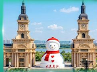
ตุ๊กตาหิมะยักษ์ ฮาร์บิน