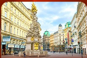
คาร์ทีเนอร์ สตรีท ออสเตรีย