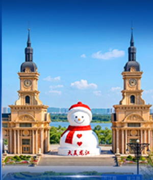
ตุ๊กตาหิมะยักษ์ ฮาร์บิน