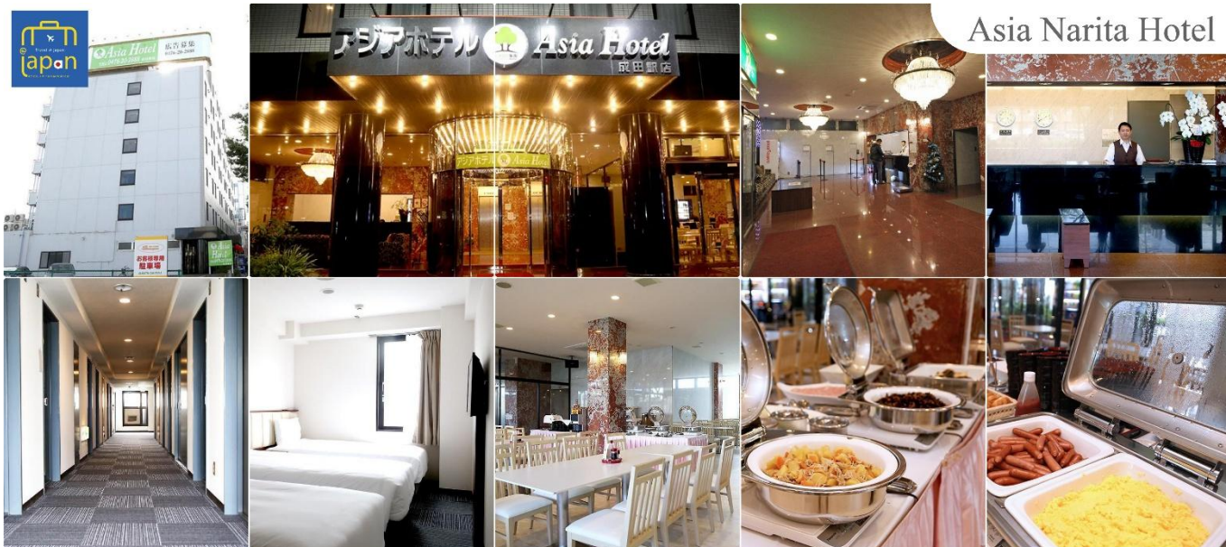
Asia Narita Hotel

ASIA HOTEL NARITA หรือเทียบเท่าระดับเดียวกัน