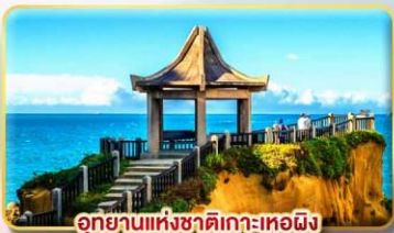
อุทยานแห่งชาติเกาะเหอผิง

เมืองไทเป หรือเทียบเท่า 4* ตามมาตรฐานไต้หวัน