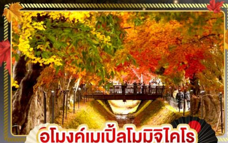
อุโมงค์เมเปิ้ลโมมิโคโร