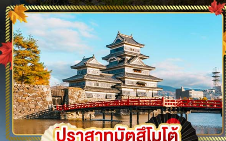
ปราสาทมิตสึโมโด้