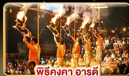
พิธีสงคา อารตี