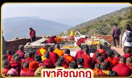
เขาคิชฌกูฏ