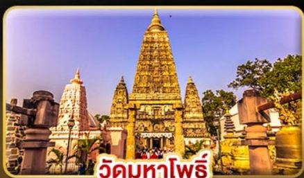
วัดมหาโพธิ์