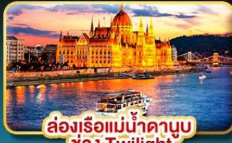
ส่องเรือแม่น้ำดาบুব ช่วง Twilight