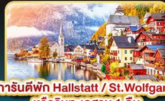
การ์นต์พัก Hallstatt / St. Wolfgang หรือริมทะเลสาบ 1 คืน