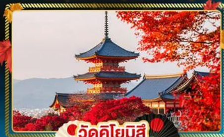
🍁 วัดคิโยมิสึ