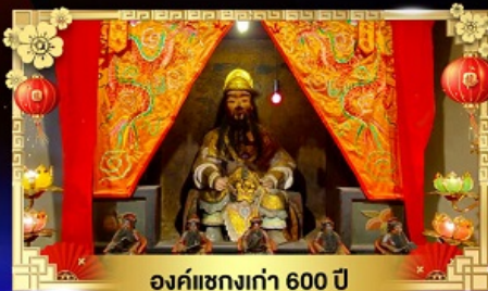
องค์แซงเก่า 600 ปี