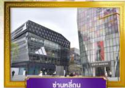
ชานหลู่กู่