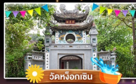
วัดหิ่งฮ็อกเซิน