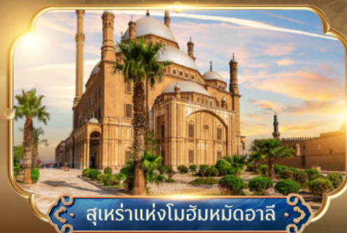
สุเหร่าแห่งโมฮัมหมัดอาลี