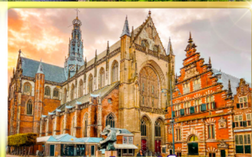
จัตุรัสเมืองฮาร์ลิม

พรมแดนเมืองแปลกเนเธอร์แลนด์และเบลเยียม เดินเมืองเคลฟท์ เมืองเครื่องปั้นดินเผาระดับโลก ฮาร์ลิมเมืองมั่งคั่งที่สุดของเนเธอร์แลนด์