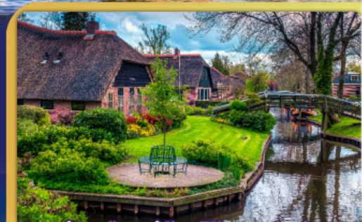
ล่องเรือหมู่บ้านไรทอนนทีธูร์น