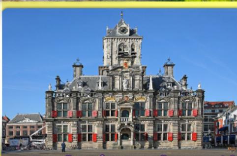
อาคารเมืองเก่าคลองเมืองเคลฟท์